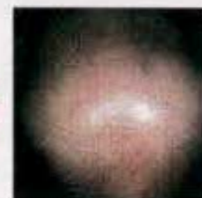
進行の程度には個人差があります。